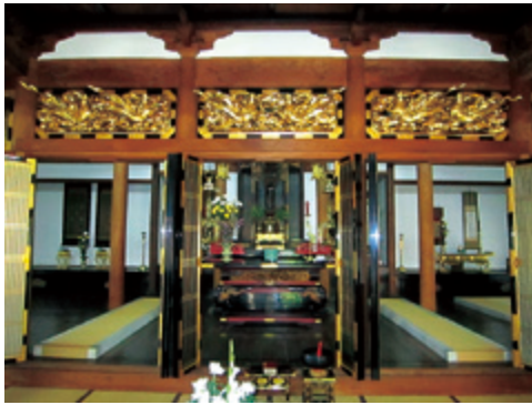
梧鳳山 西誓寺 本堂