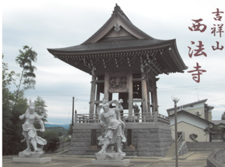
●東北一の高さ 12mの鐘楼堂