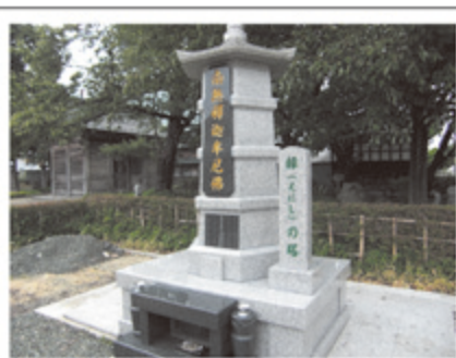
●永代供養塔 『緑（えにし）の塔』

お寺は明るい場所です。そんな 明るい場所でご先祖様は祀ら れています。だから、生きた人 も安心する場所です。生きた人 がお参りすればご先祖様がよろ こびます。ご先祖様がよろこべ ば、これ供養になります。 いつでもお参りに来て下さい。