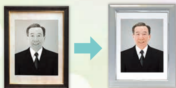
②白黒の写真をカラー写真に