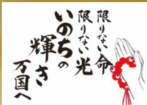
「セル(細胞)」をイメージした赤い円を連ね、万博のテーマ「いのちの輝き」を表現。

阿弥陀仏の「無量寿」・「無量光」と2025年に開催される「大阪万博」のロゴマークのテーマをうまく組み合わせた作品です。永明寺(浄土真宗本願寺派・福岡県北九州市)