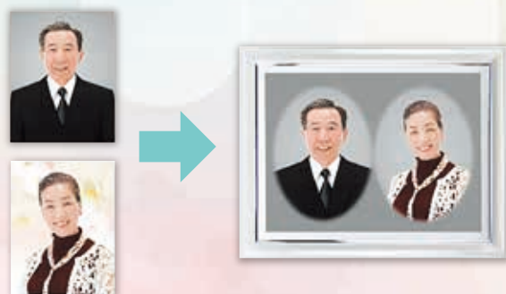
③ご夫婦別々のお写真を一枚のお写真に合成