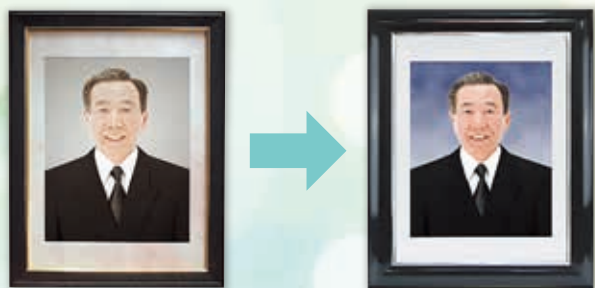
①色あせて変色したカラー写真から 鮮やかなカラー写真へ