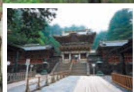
栃木県 日光東照宮