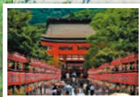
京都府 伏見稲荷大社

現在日本には多くの「神社」があり、それぞれ様々な神様が祀られています。そんな神社の「名前」に疑問を持ったことはないでしょうか。ほとんどの神社が「神社」と呼ばれている中で、特定の神社は「○○神宮」や、「○○大社」と名付けられていることがあります。この名前はどのように分類されていて、どのような違いがあるのでしょうか。 ここでは、「神社の名称」についてご紹介していきます。