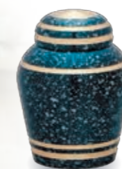
Petit Pot 骨壺タイプ