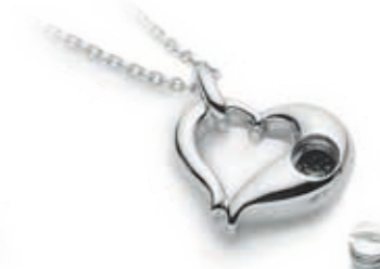
Jewelry ネックレスタイプ