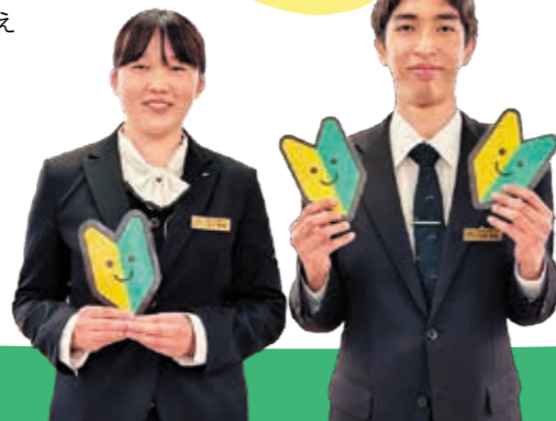
こだま 見玉 はるか 悠権

③ 周りの状況を見ながら、自分から動けるようになり、安心して任せていただける存在になりたいです。