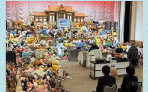
令和7年10月開催 人形供養祭の様子